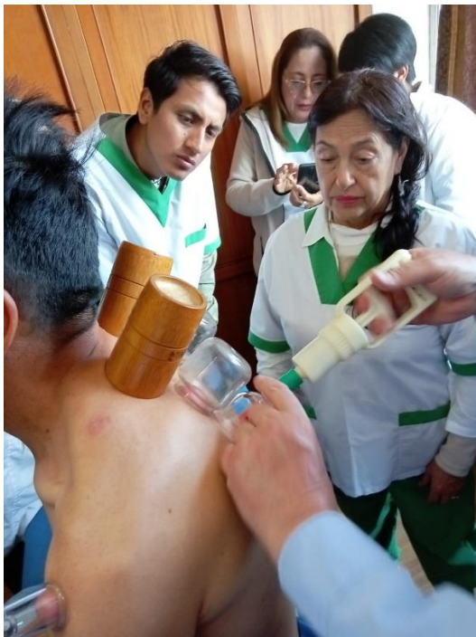
Aplicación de ventosas en puntos indicados