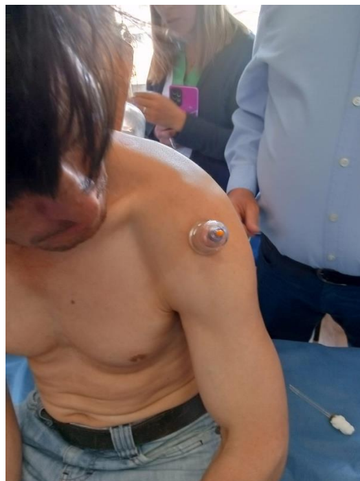
Aplicación de ventosas