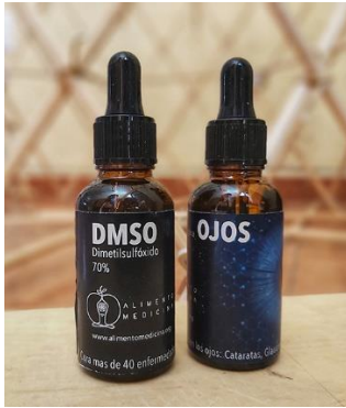
Gotero de DMSO